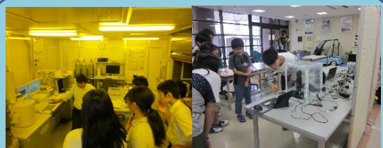
第1回公開講座の様子

普段は絶対に見ることのできない「ナノ」の世界を専門的な装置を使って実際に実験や観察をします。たのしく体験しながら学ぶプログラムとなっています。