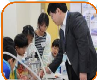
アルミ蒸着による鏡