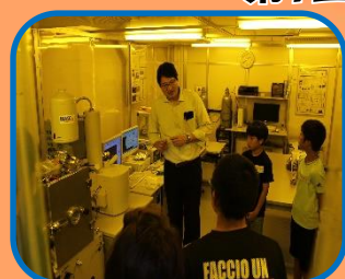
電子ビーム描画 パターン