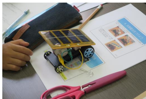
■ 完成したソーラーカー