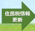
2021年秋の在学採用に申し込んだとき